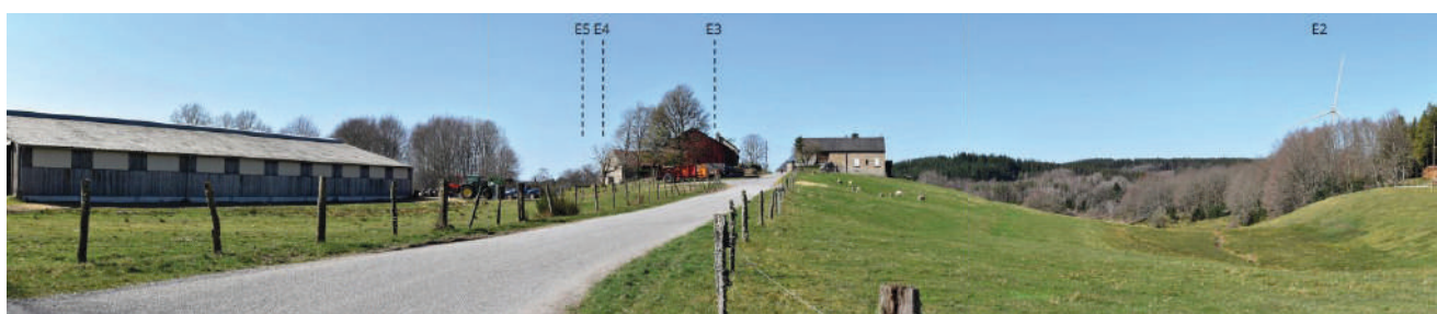
Prise de vue depuis Orluc