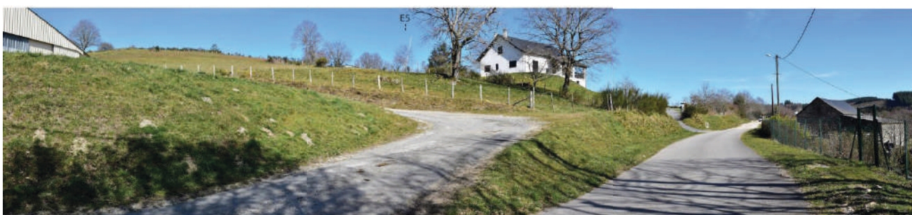
Prise de vue depuis Le Bec