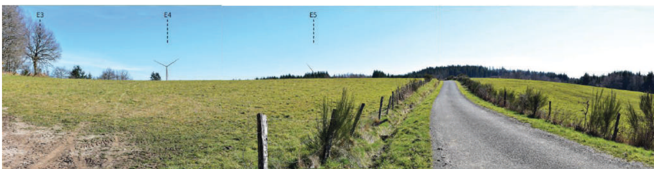
Prise de vue depuis la route d'accès à Broussouloux