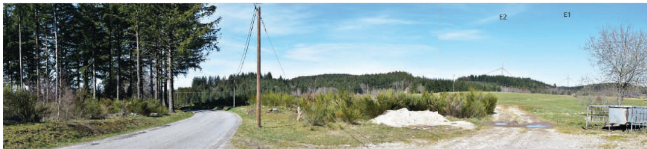
Prise de vue depuis la D18 au nord de La Nouaille

Découvrez quelques photomontages réalisés dans le cadre de l'étude paysagère. Vous pouvez en consulter davantage sur le site internet du projet : www.projeteolien-millevents.fr